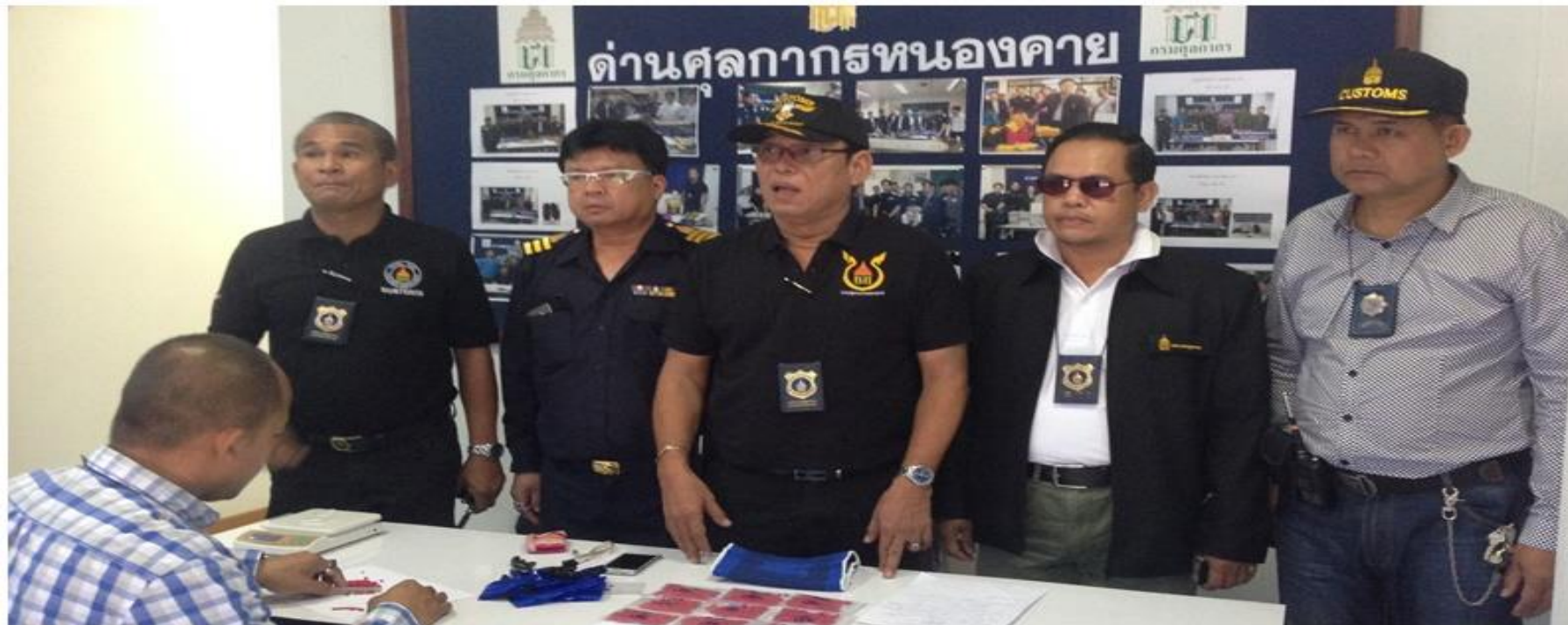
นายด่านฯ นิมิตรฯ แถลงข่าวการจับกุม